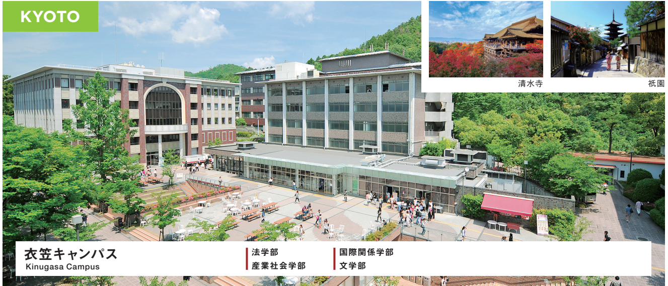
衣笠キャンパス Kinugasa Campus