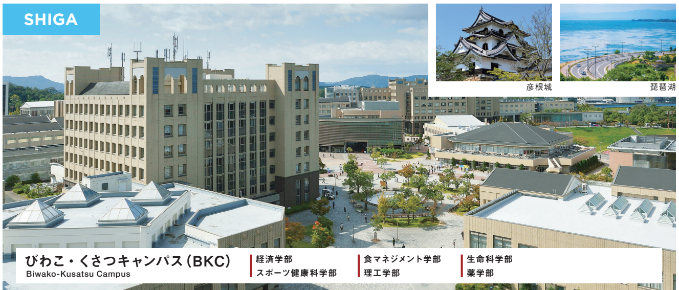
びわこ・くさつキャンパス (BKC) Biwako-Kusatsu Campus