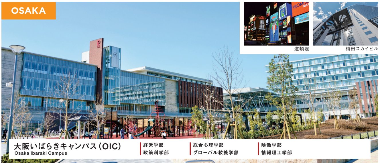
大阪いばらきキャンパス (OIC) Osaka Ibaraki Campus