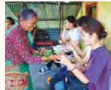
「平和人権フィールドスタディ」のネパールプログラムではフェアトレード団体と交流

本学の教育理念「平和と民主主義」と深く関連するテーマ(市民性、平和、人権、ダイバーシティなど)を学び、現代社会を生きる上で必要となる批判的思考力、科学・技術と社会の関係をとらえます。多様な価値の尊重、他者との対話・協働、自由で責任ある思考・行動ができる地球市民になるための土台となる科目群です。