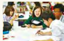
「Cross-cultural Encounters 1」では日英両言語を駆使して留学生と議論

異文化間の相互理解力やコミュニケーション力を涵養する科目群。授業言語は英語や初修外国語です。討論や発表、留学生との学びあいを重視しています。